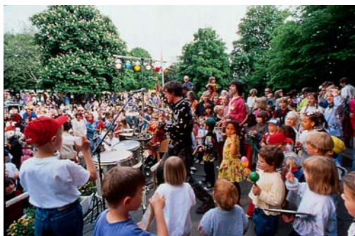
Laut und Luise, Hamburg